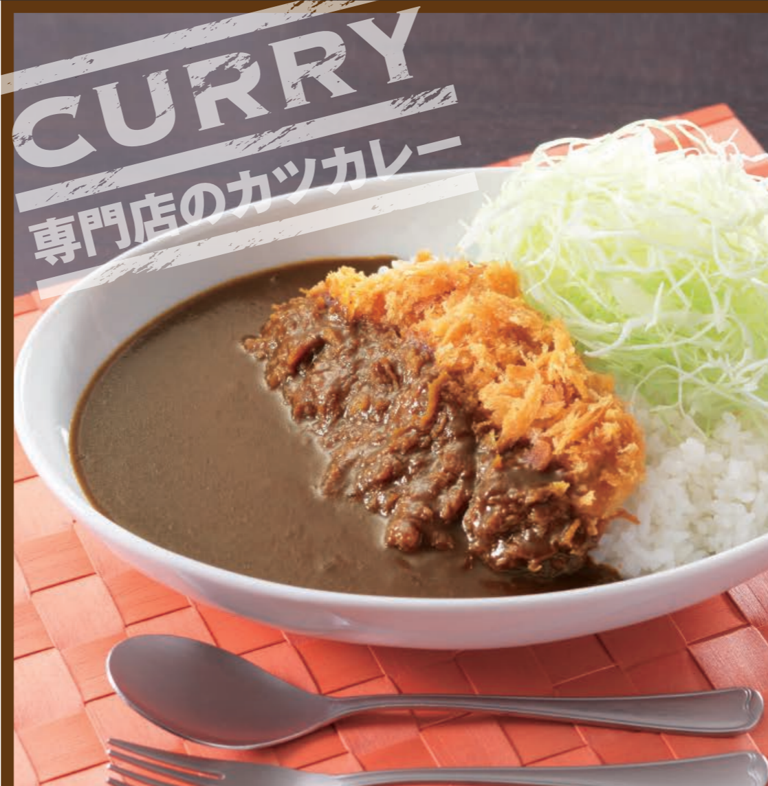
カツカレー(梅) 80gロース 690円 (税込759円)