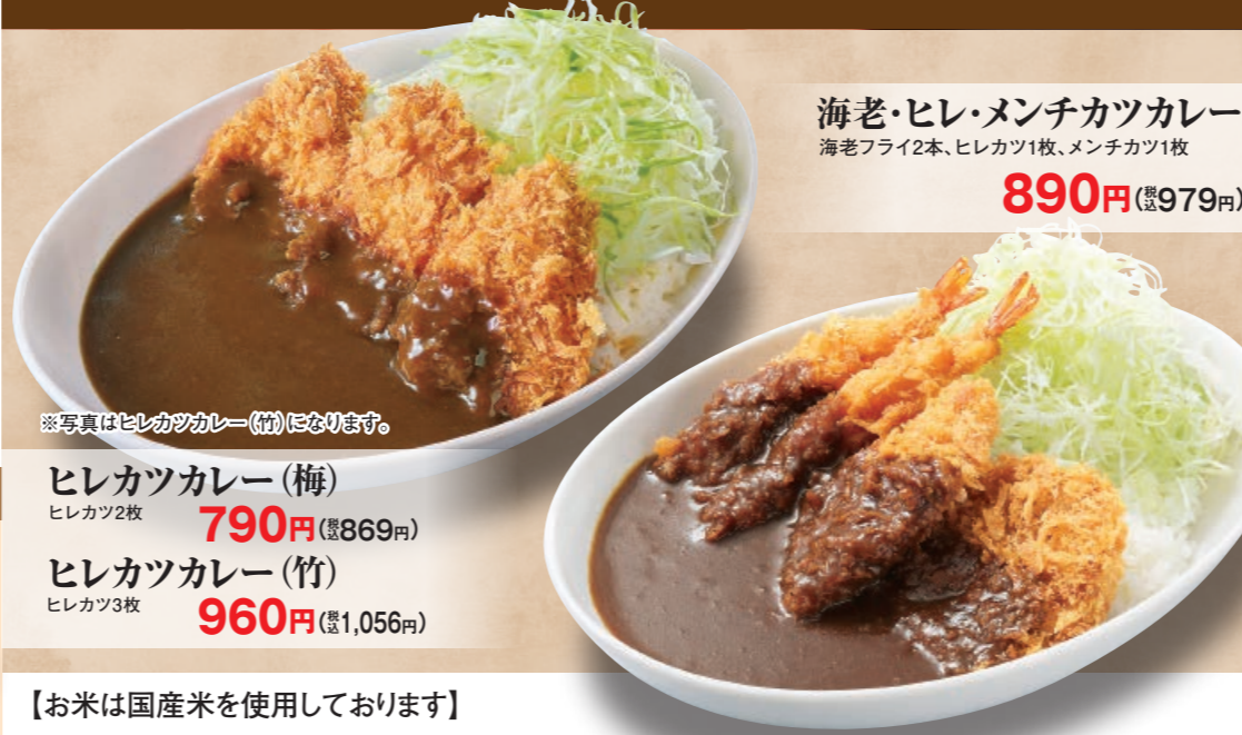
ヒレカツカレー(梅) ヒレカツ2枚 790円 (税込869円)