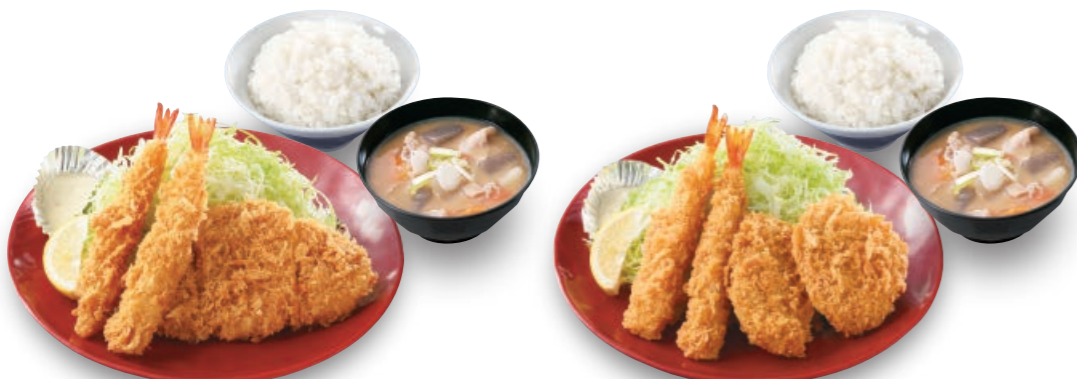
海老・ロースカツ定食 海老フライ2本 80gロース 850円 (税込935円)