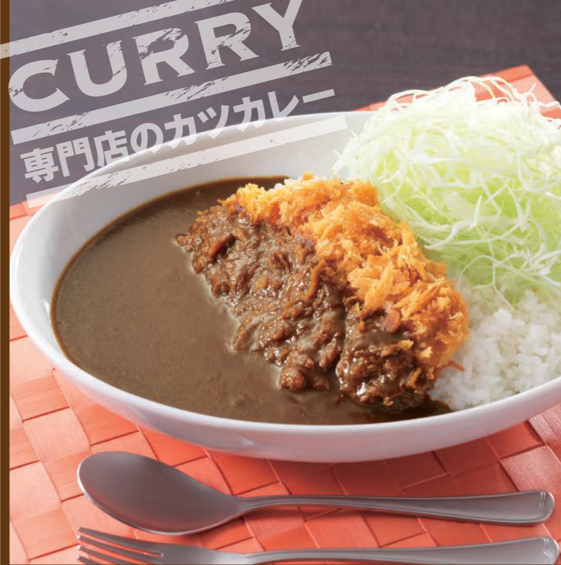
カツカレー(梅) 80gロース 690円 (税込759円)