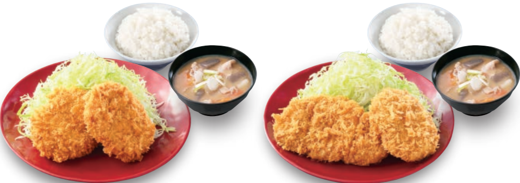
メンチカツ定食 メンチカツ2枚 690円 (税込759円)