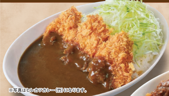
ヒレカツカレー(梅) ヒレカツ2枚 790円 (税込869円)