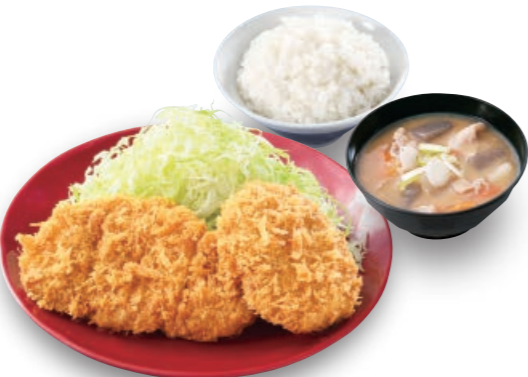
ロース・メンチカツ定食 80gロース メンチカツ1枚 820円 (税込902円)