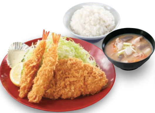
海老・ロースカツ定食 海老フライ2本 80gロース 850円 (税込935円)