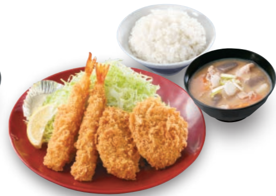
海老・ヒレカツ定食 海老フライ2本 ヒレカツ2枚 890円 (税込979円)

※定食のおかずのみ(一部商品を除く)は、税抜価格より200円引きさせていただきます。