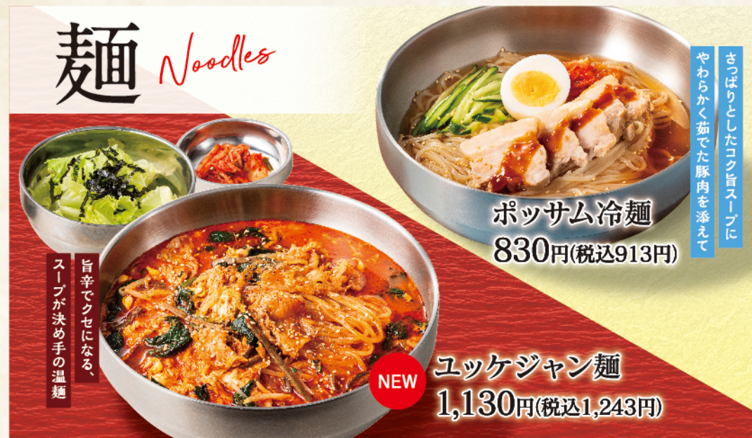
ポッサム冷麺 830円(税込913円)