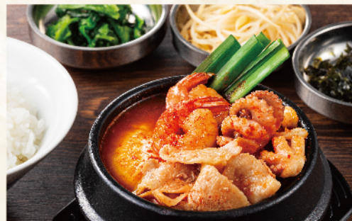
MIXスンドゥブ定食<海老、イダコ、イカ、豚肉> 1,180円(税込1,298円)