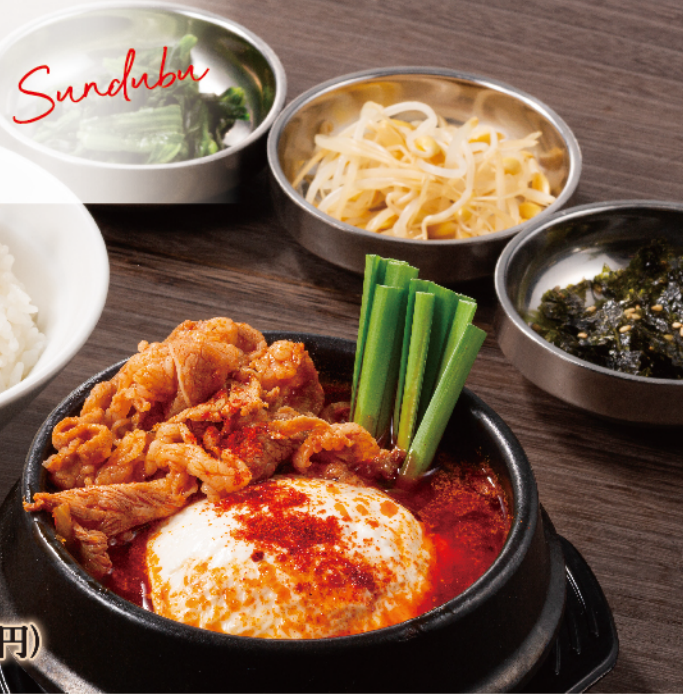
牛プルコギ スンドゥブ定食 1,030円(税込1,133円)