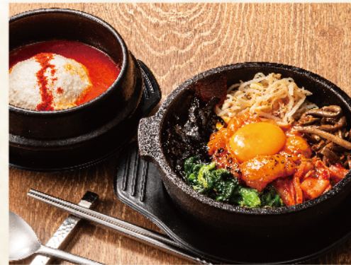
牛ホルモン 石焼ビビンバセット 1,030円(税込1,133円)