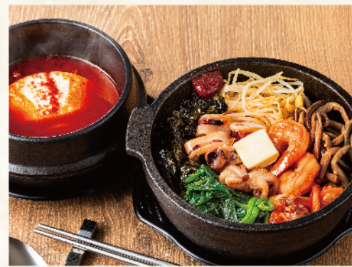
海鮮石焼ビビンバセット <海老、イダコ、イカ> 1,130円(税込1,243円)