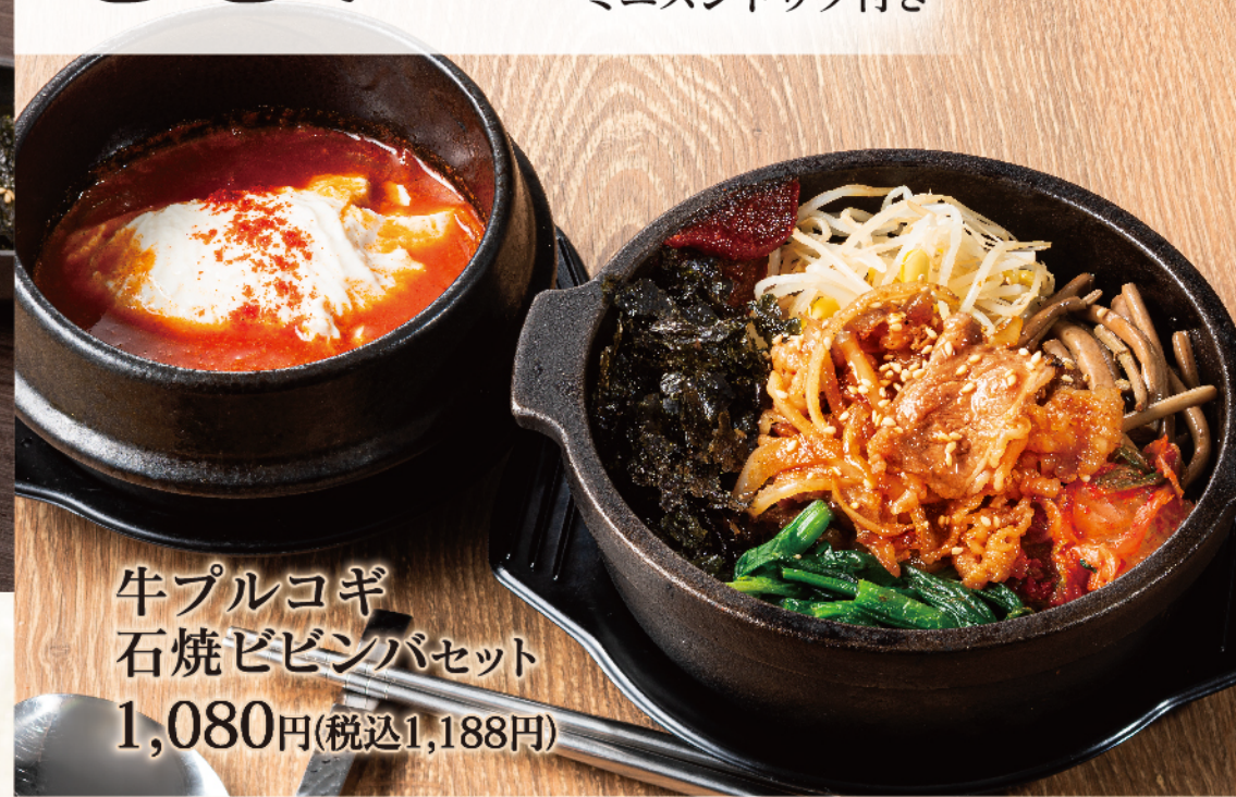
牛プルコギ 石焼ビビンバセット 1,080円(税込1,188円)