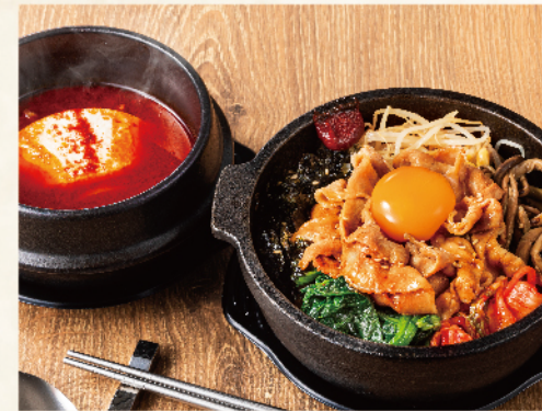
豚カルビ 石焼ビビンバセット 1,080円(税込1,188円)