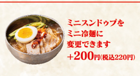
ミニスンドゥブを ミニ冷麺に 変更できます +200円(税込220円)