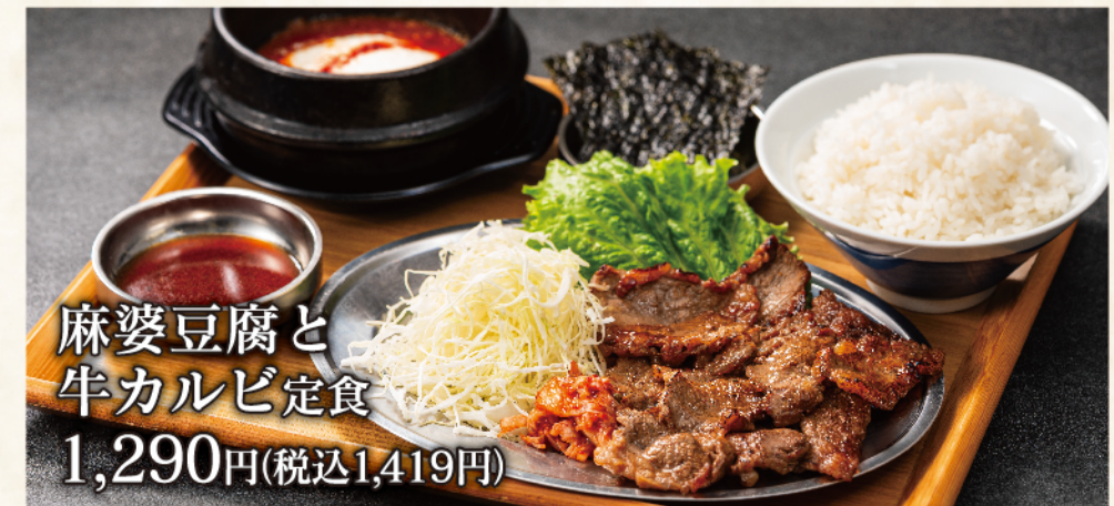
麻婆豆腐と 牛カルビ定食 1,290円(税込1,419円)