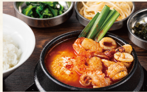
海鮮スンドゥブ定食<海老、イダコ、イカ> 1,080円(税込1,188円)