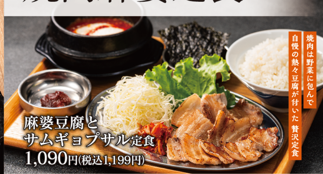
麻婆豆腐と サムギョプサル定食 1,090円(税込1,199円)