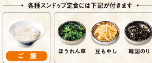
・各種スンドゥブ定食には下記が付きまして・