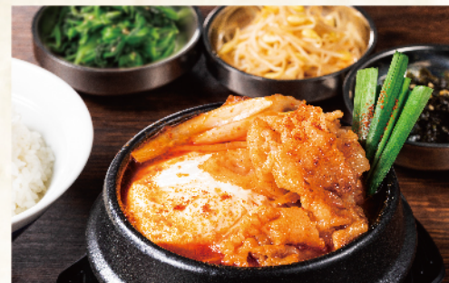
豚カルビスンドゥブ定食 1,030円(税込1,133円)