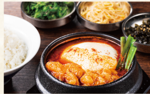
牛ホルモンズンドゥブ定食 980円(税込1,078円)