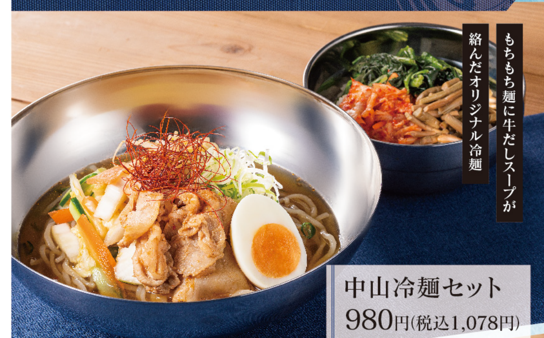
中山冷麺セット 980円(税込1,078円)