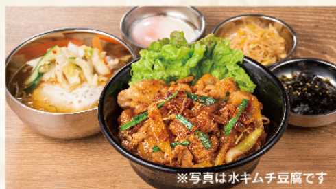
※写真は水キムチ豆腐です

豚プルコギ丼セット 930円(税込1,023円) ※お米は国産米を使用しております