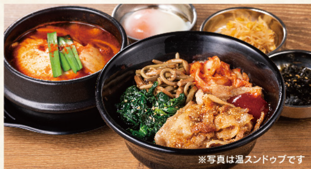
※写真は温スンドゥブです