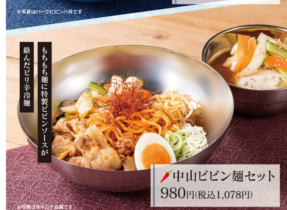
中山ビビン麺セット 980円(税込1,078円)