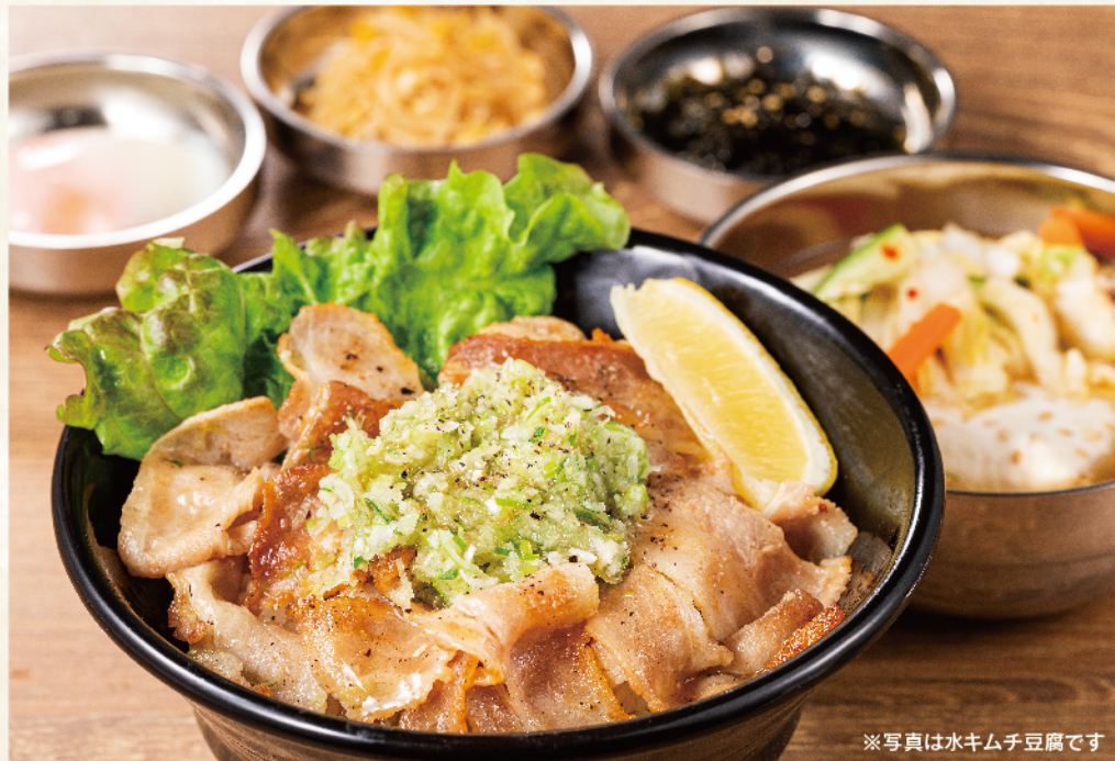
※写真は水キムチ豆腐です