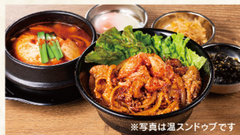
※写真は温スンドゥブです

豚プルコギ丼セット 930円(税込1,023円) ※お米は国産米を使用しております